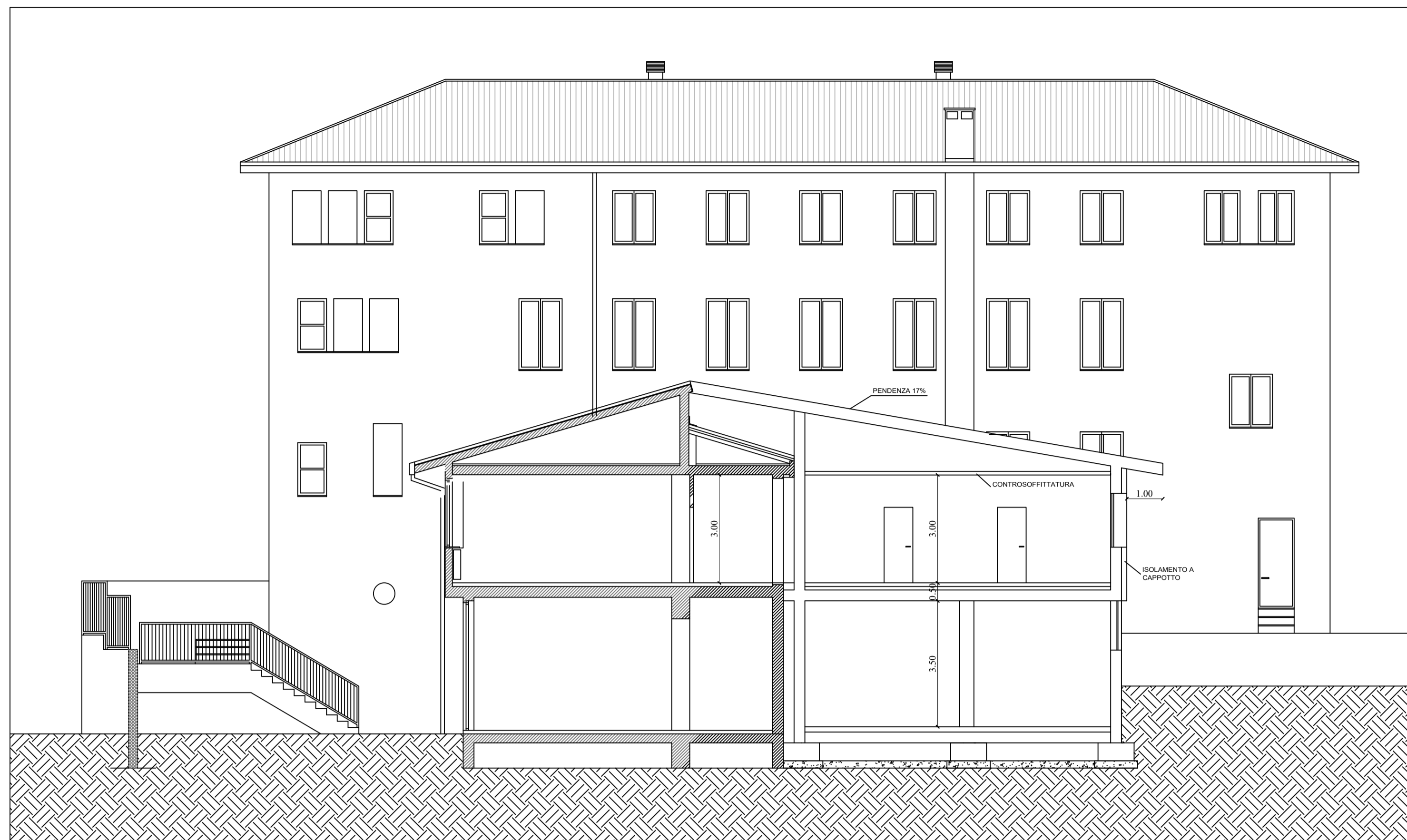
SEZIONE TRASVERSALE A:A