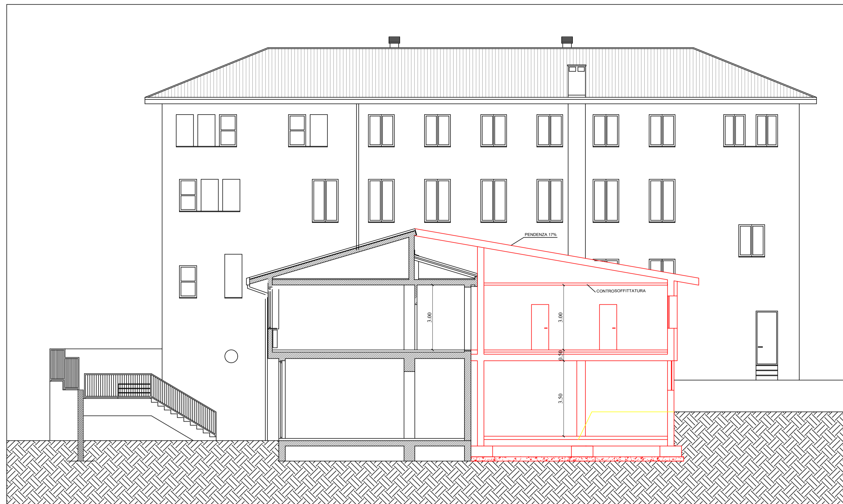
SEZIONE TRASVERSALE A:A