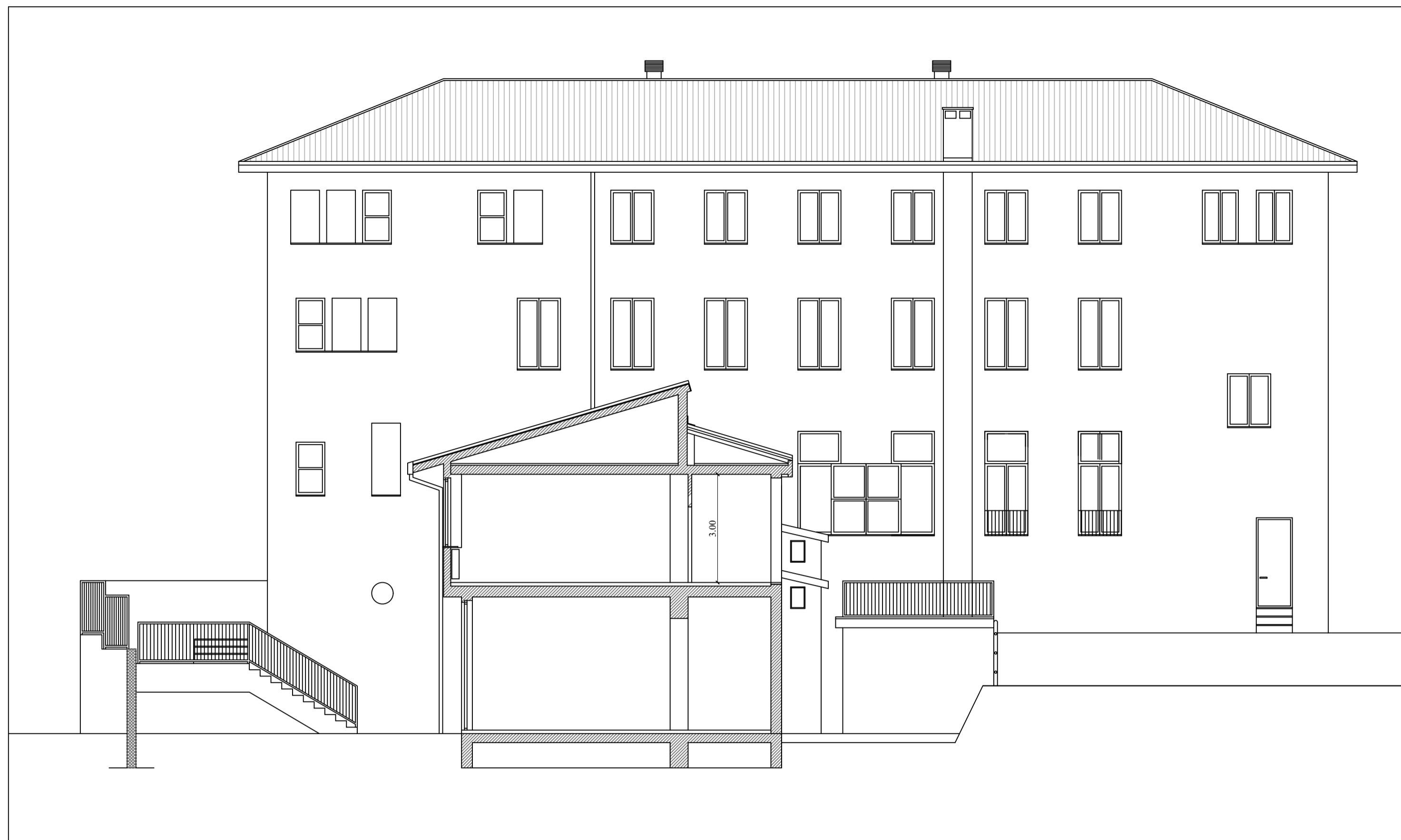
SEZIONE TRASVERSALE A:A